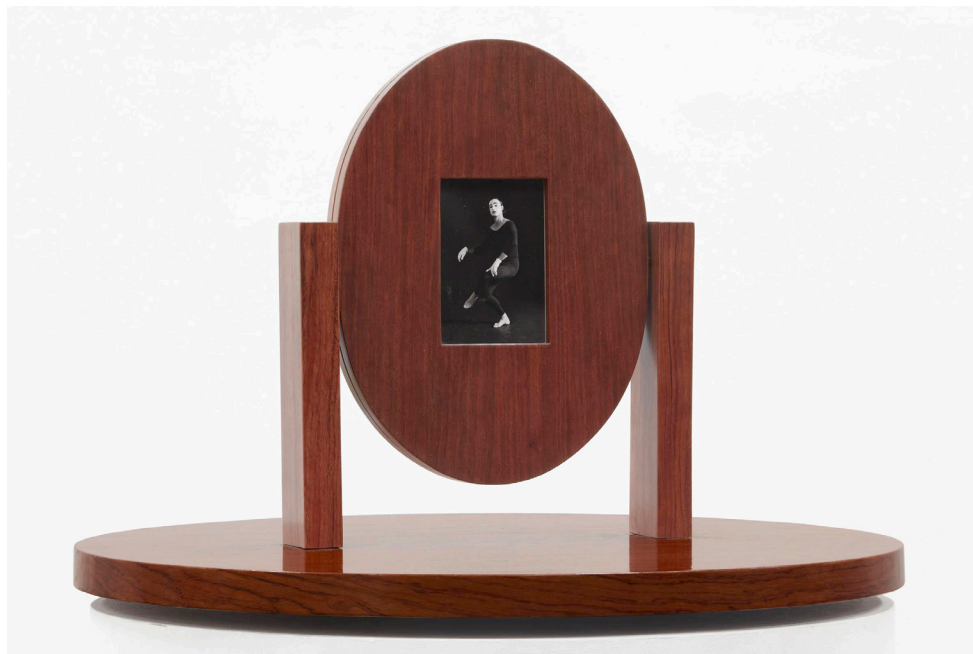
Rescue attemp. Nonsense [Tentativa de salvación. Absurdo], 1994. Museo Reina Sofía

En Meridiano de Madrid: sueño y mentira Pep Agut reflexiona sobre estas circunstancias desde el momento presente, el de una contemporaneidad que todavía no ha logrado zafarse de unos cimientos construidos con toda la perversidad de los regímenes monárquicos absolutistas. En su argumentación, el artista catalán parte de la forma e historia del propio edificio, diseñado por Ricardo Velázquez Bosco para la Exposición General de las Islas Filipinas e inspirado en el Crystal Palace (Londres, 1851) de Joseph Paxton. El artista nos invita a releer y experimentar aquellos tiempos y sus amplias similitudes con nuestro presente.